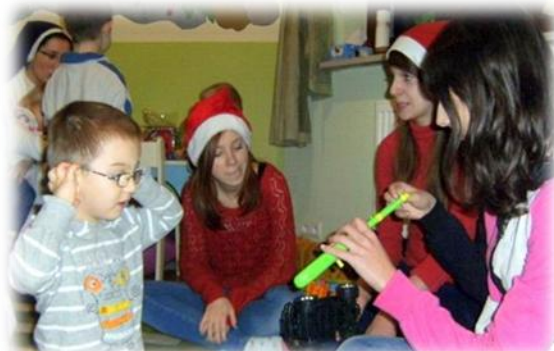
SPĘDZAMY MIŁO CZAS

Ciekawą inicjatywą mogą się pochwalić gimnazjaliści, którzy wraz z pedagogiem szkolnym stworzyli bank samopomocy koleżeńskiej w nauce. W ramach akcji „Zostań korepetytorem ZS 11” starsi uczniowie pomagają młodszym w nauce. Akcja przynosi wiele korzyści wychowawczych. Uczniowie uczą się współpracy i bezinteresownej pomocy.