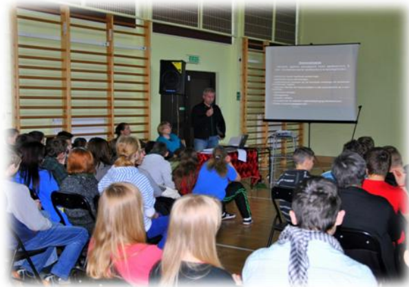
SPOTKANIE Z KURATORAMI SĄDOWYMI NA SALI GIMNASTYCZNEJ